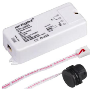
SR-2005 SR-2005 SILVER-R